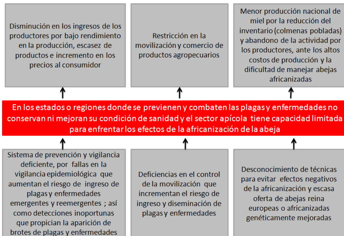
Figura 4. Árbol de problemas Causas y Efectos