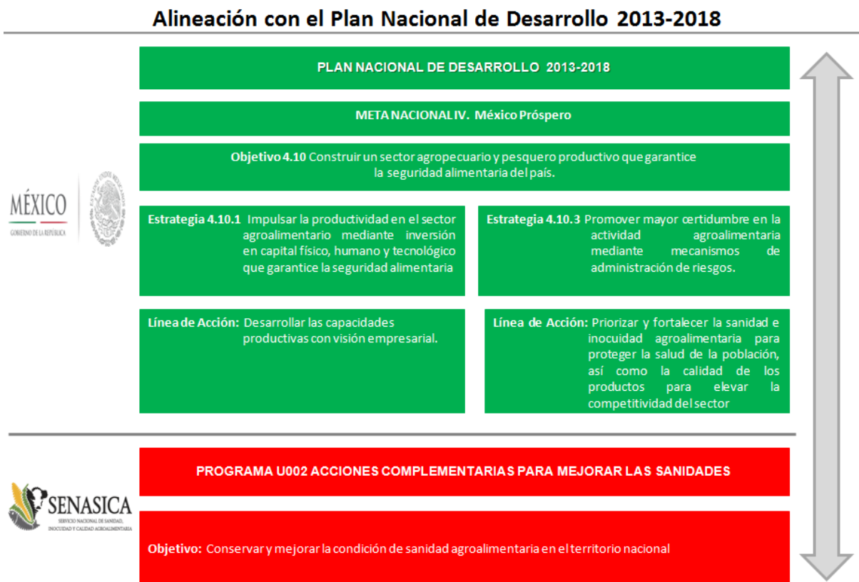
Figura 1. Alineación al Plan Nacional de Desarrollo 2013-2018