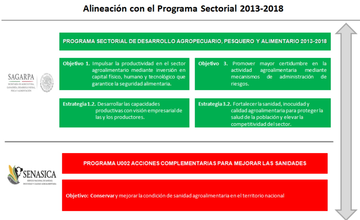
Figura 2. Alineación al Programa Sectorial 2013-2018

mayor certidumbre en la actividad agroalimentaria mediante mecanismos de administración de riesgos, y a las Estrategias 1.2. Desarrollar las capacidades productivas con visión empresarial de las y los productores; y 3.2: Fortalecer la sanidad, inocuidad y calidad agroalimentaria para proteger la salud de la población y elevar la competitividad del sector.