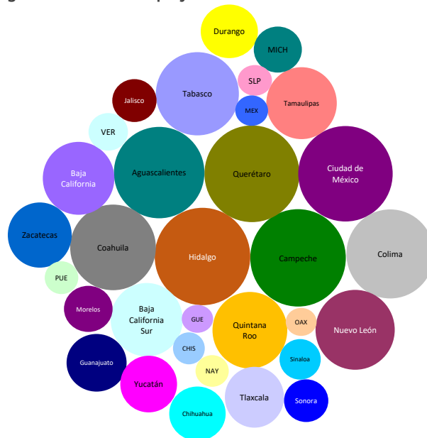
Figura 3: Validación de proyectos en las entidades federativas*

*Un área mayor significa un mayor esfuerzo de la entidad por validar los proyectos