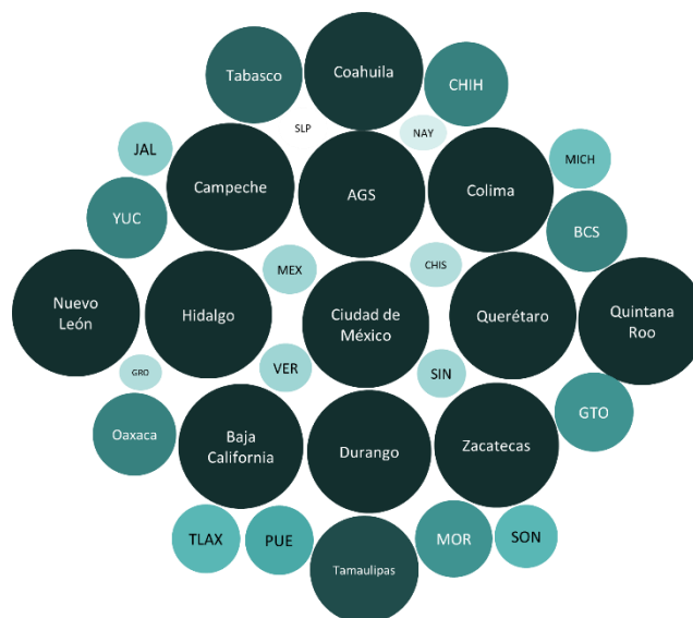
Figura 3: Validación de proyectos en las entidades federativas, cuarto trimestre 2020*

*Un área mayor significa un mayor esfuerzo de la entidad por validar los proyectos