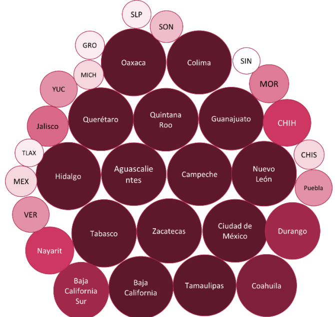
Figura 3: Validación de proyectos en las entidades federativas, segundo trimestre 2022

La información reportada a través del SRFT muestra que aún existen áreas susceptibles de mejora. Sin embargo, destacó que ocho estados validaron el 100% de sus proyectos.